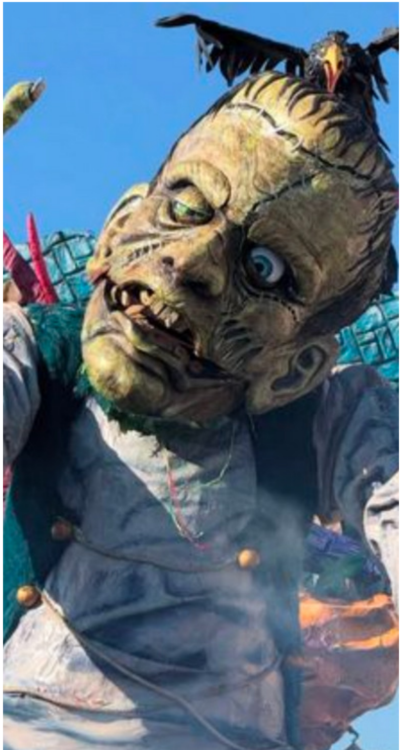
Un particolare del carro di Allegrucci

Sicuramente ne riscontro maggiormente nella parte della carpenteria, riguardo alla costruzione dei ferri e nella fase iniziale nella quale bisogna trovare un posto ad ogni pezzo che compone il carro..