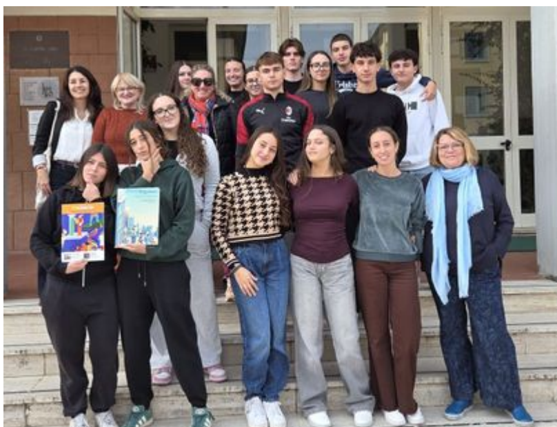
La redazione davanti al Liceo Barsanti e Matteucci