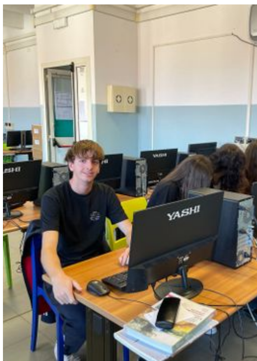
Alcuni studenti durante la scrittura e l'impaginazione di articoli