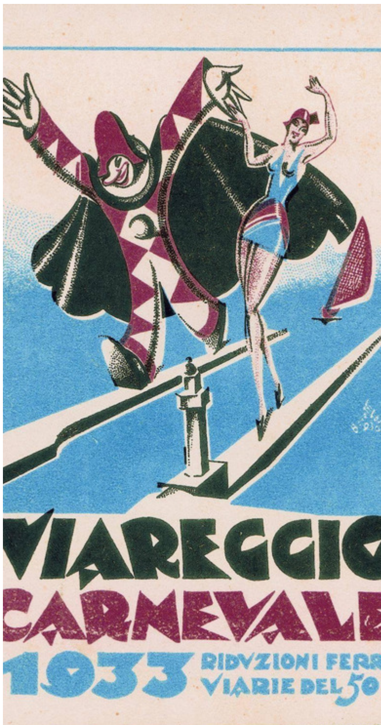
Classe 3G, a.s. 2022/203

Questa celebrazione unica ha radici profonde che affondano nel passato, risalendo oltre un secolo fa. Le origini di questa festa risalgono al lontano 1873, quando un gruppo di giovani appassionati di arte e cultura decisero di organizzare un evento che unisse l'arte alla satira politica. Il Carnevale di Viareggio nacque così come una manifestazione di protesta mascherata contro le ingiustizie sociali e politiche del tempo. Negli anni successivi, il Carnevale di Viareggio si trasformò in un evento sempre più grande e popolare. Nel corso del Novecento la festa crebbe in fama e importanza, attirando visitatori da tutto il mondo. Il Carnevale di Viareggio divenne un trampolino di lancio per artisti e sarti che si sfidavano a creare le più stravaganti e spettacolari carrozze allegoriche. Le carrozze diventarono presto l'elemento centrale del Carnevale di Viareggio, con dimensioni che raggiungono anche i venti metri di altezza e la capacità di ospitare decine di figuranti. Ogni carrozza era una vera e propria opera d'arte, ricoperta di cartapesta e dipinta a mano con colori vivaci e immagini satiriche che rappresentavano personaggi politici, celebrità e temi di attualità. Negli anni, il Carnevale ha affinato il suo stile unico, combinando la satira politica con l'umorismo e il divertimento. Ogni anno, migliaia di visitatori affollano le strade di Viareggio per assistere alle sfilate delle carrozze, ammirandone la creatività.